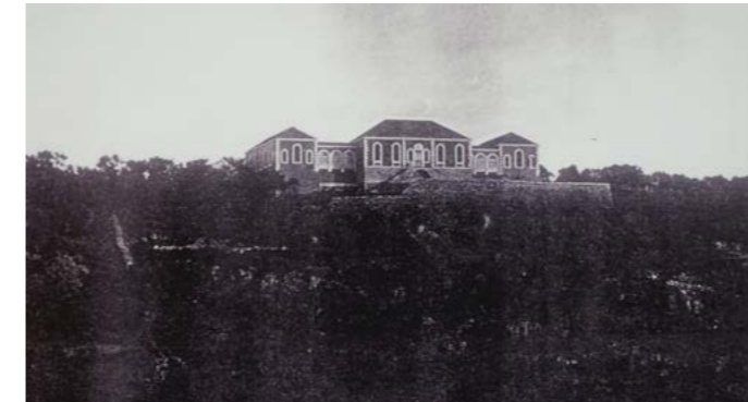
جمعية الخدمات الاجتماعية

تأسس مستشفى جمعية الخدمات الإجتماعية في العام ١٩٥١ في طرابلس بهدف رعاية المسنين والمعوقين من ذوي الإحتياجات الخاصة. وهو مجال لم يكن موجودا في تلك الحقبة. وكان المؤسسون كوكبة من رجال الثقافة والعلم والوجوه الإجتماعية في ذلك الوقت برئاسة الأستاذ مدوح النملي. وقد واكبت الجمعية إحتياجات المجتمع وتصدت لموضوع الإعاقات أثناء الحرب الأهلية ولا تزال تشكل مرجعا مهما في مجال إعادة التأهيل. وتطمح إلى أن تكون مركزا نموذجيا لجميع المشاكل الصحية النفسية والجسدية التي تتعلق بكبار السن والمعوقين. كما أنها مستعدة على مواكبة حاجات المجتمع المستجدة على أكثر من صعيد.