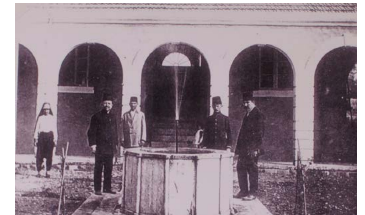
مركز جمعية الخدمات الاجتماعية

يهدف المستشفى من خلال الخدمات التي يؤمنها إلى تغطية حاجات المقيمين فيها بشكل أساسي وخدمة المحيط الجغرافي أيضا. وهو يؤمن: • رعاية المسنين والعجزة: حيث يستقبل المسنين والعجزة من جميع المناطق اللبنانية إضافة إلى المرضى من طرابلس والشمال ويقدم لهم السكن والملبس والتغذية والرعاية الطبية والعلاجية. كما أن لديه قسما خاصا بمرضى الزهايمر. • علاج فيزيائي للمرضى المصابين بالشلل والإعاقات القابلة للتأهيل وقد أصبح منذ فترة طويلة مركز تدريب جامعي معتمد من قبل الجامعة اللبنانية. • يقدم أيضا الخدمات التشخيصية من خلال المستوصف وتخطيط العضلات EMG وتخطيط الدماغ EEG على يد أطباء مشهود لهم بالعلم والثقة. • طب الأسنان حيث نهدف إلى تأمين الوسائل اللازمة من أجل أن يستمر العاجز في صحة وتغذية جيدين ما يسمح له بالبقاء في نشاط وحركة للعيش مستقلا قدر الإمكان. • التصوير الشعاعي ما يسمح للمقيمين بالحصول على التشخيص