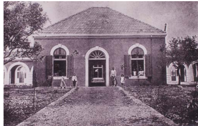
مدخل المستشفى من الجهة الشرقية

اللازم عند حصول أي حادث إضافة إلى خدمة المحيط بأسعار منخفضة. المختبر الذي يسمح بالحصول على الفحوصات الروتينية للمرضى بسهولة.