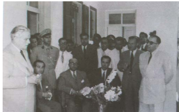
استقبال الرئيس كميل شمعون في مركز جمعية الخدمات الاجتماعية