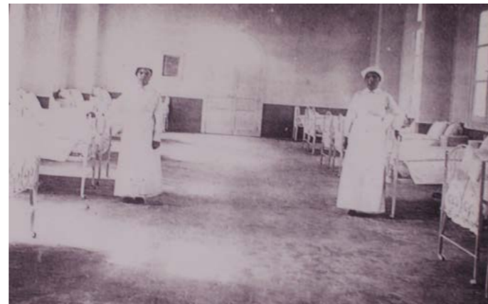
مرضتان وأسرة المرضى داخل المستشفى