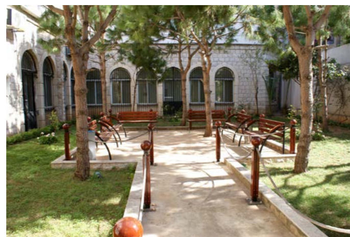
المركز الحالي لمستشفى جمعية الخدمات الاجتماعية