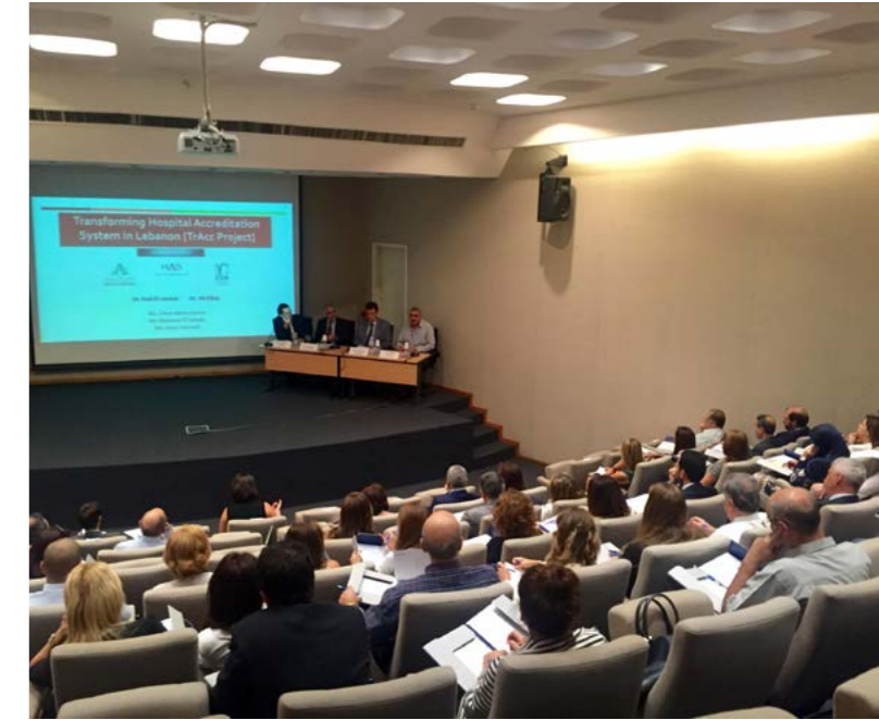
إطلاق مشروع «TrAcc» في 8 أيلول 2016 في المعهد العالي للأعمال. بيروت

استجابة للحاجة الملحة لتحسين وتطوير النظام القائم لاعتماد المستشفيات في لبنان. تم تطوير مشروع TrAcc بإشراف وتوجيه من وزارة الصحة العامة في لبنان. والأسم بالإنكليزية هو اختصار لاسم «تحويل نظام اعتماد المستشفيات في لبنان»