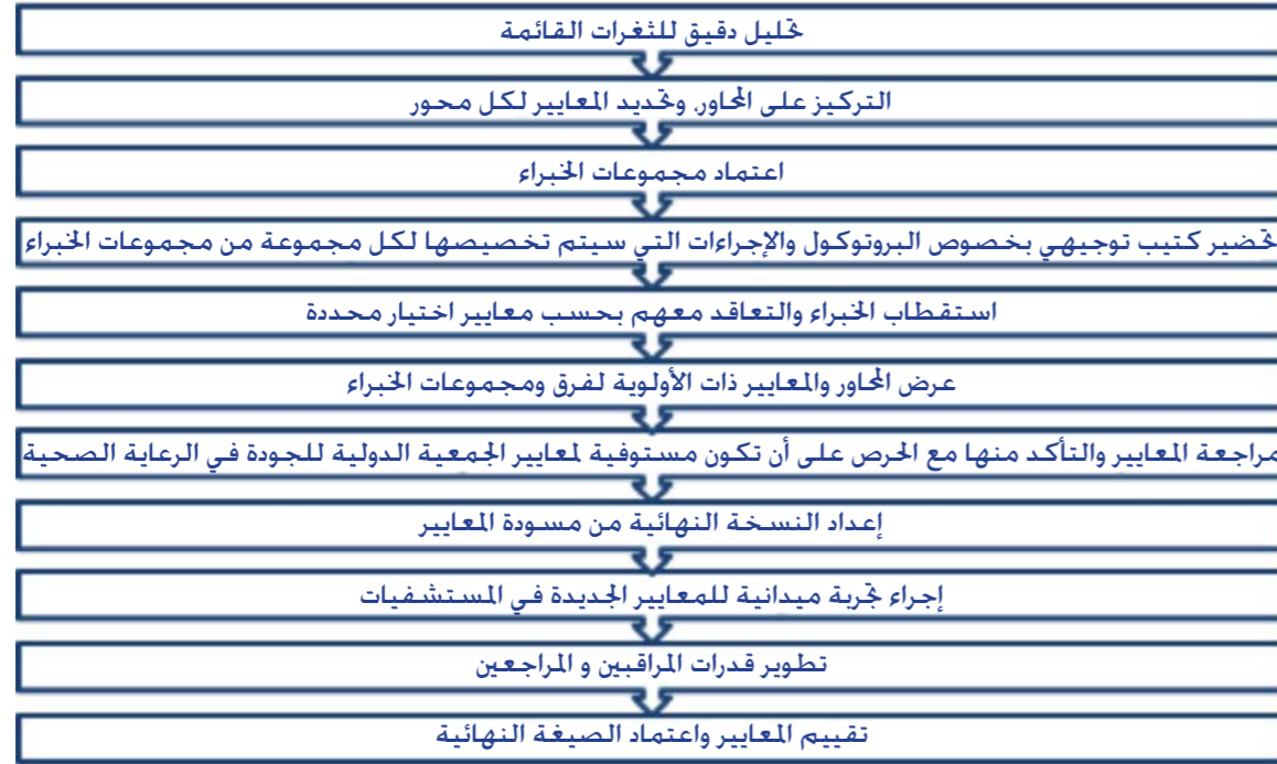
الرسم البياني 1: ترانبة مراحل العمل في مشروع «TrAcc»

أما الرسم البياني (1) فيبين آليات العمل التي سيتم اتباعها. بدءاً من تحليل الثغرات القائمة ثم إعداد وتطوير المعايير بهدف اختبارها. ثم تطوير القدرات والتقييم.